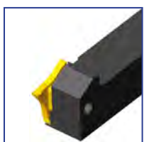
M92 Q...L Система M92-Q

Левосторонняя державка для левосторонней пластины